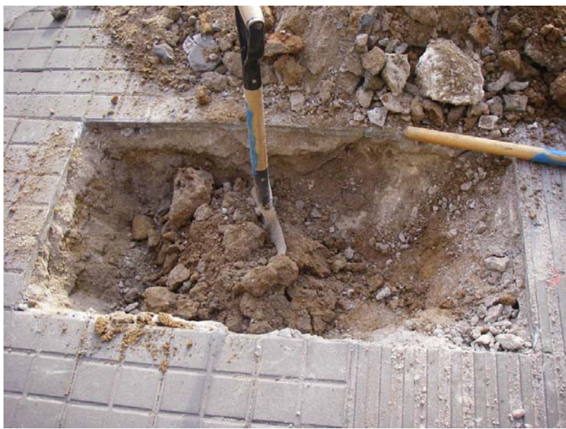
Fotografia núm. 3. vista del tast n o 2 després integrada a la rasa 100