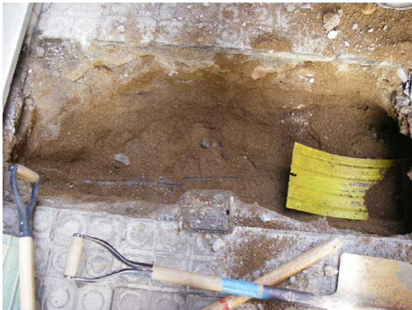
Fotografia núm. 4. Capçalera de la rasa, tallada per cables de la llum