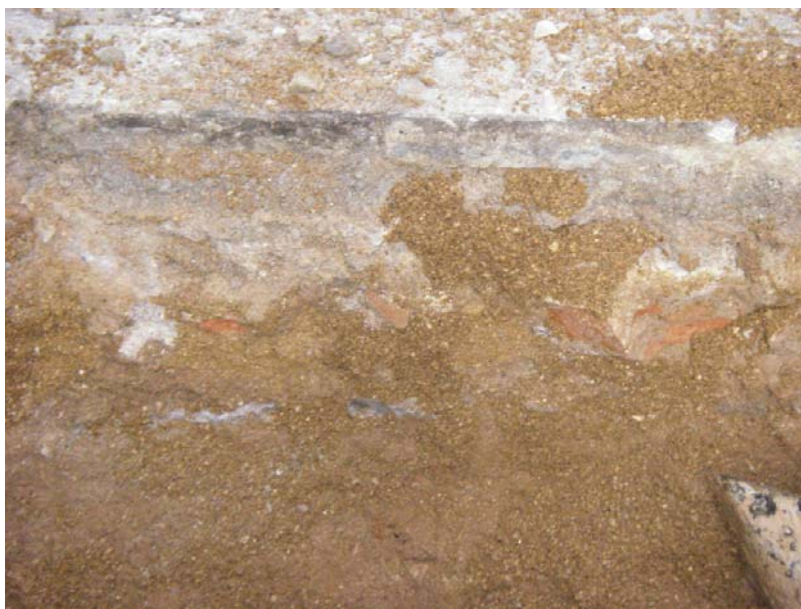
Fotografia núm. 2.

Vista general de la zona on es va efectuar la rasa 100, mirant al est-oest.